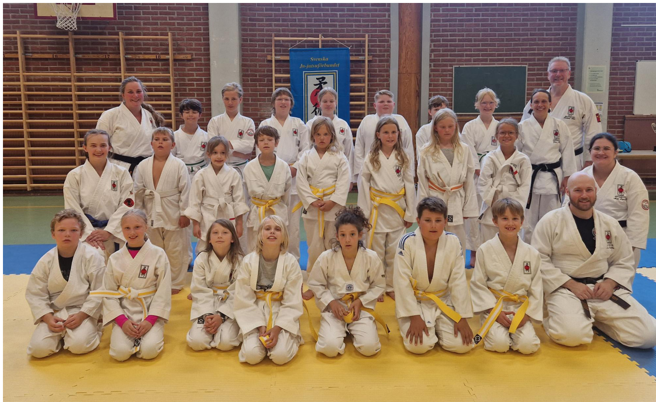
Barnsommarsläger i Borgholm 2025

Den 2-5 augusti genomförde Svenska Ju-jutsuförbundet sitt midsommarsläger i Borgholm.